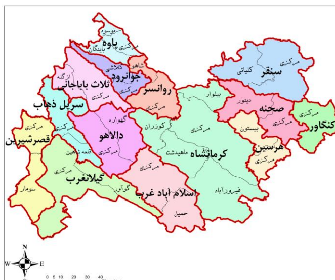
نقشه استان کرمانشاه

بطور کلی ویژگیهای طبیعی (آب و هوا، ژئومورفولوژی و توپوگرافی) در تکوین و پیدایش سکونتگاههای انسانی، توسعه و گسترش آنها و یا عملکردهای گوناگونشان نقش به سزایی داشته است. چنانکه انسان تحسین به حکم ضرورت به دنبال دستیابی به آب، غذا و مسکن هر جا طبیعت مناسبی یافته اقامت گزیده و اجتماعات اولیه را بوجود آورده است. و این اجتماعات نیز به فراخور شرایط و ویژگیهای طبیعی در برخی موارد انسجام یافته و شکوفایی تمدنهای بزرگ را تجربه کرده اند و در بعضی شرایط نیز راه نیستی و زوال را پیموده اند. این ویژگیهای طبیعی گاه راه توسعه و پیشرفت را برای جوامع هموار می سازد (جنبه های مثبت) و زمانی نیز سد راه توسعه می شود (جنبه منفی). بنابراین شناخت ویژگیهای طبیعی یکی از ارکان اصلی در برنامه ریزیها و اجرای پروژه های عمرانی است.